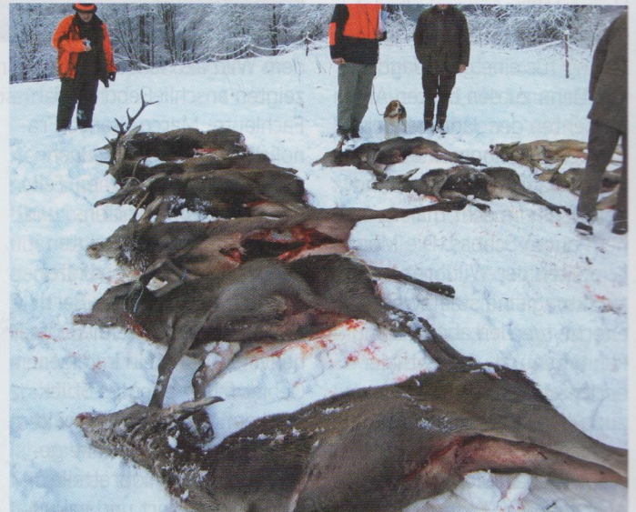
Dabei gibt es nicht nur ansehnliche Rotwildstrecken, ...

fung erfolgreich geführt. Seit fünf Jahren ist er sowohl Mitglied im Verein für Deutsche Wachtelhunde als auch in der Stöberhundegruppe VDW Baden-Württemberg.